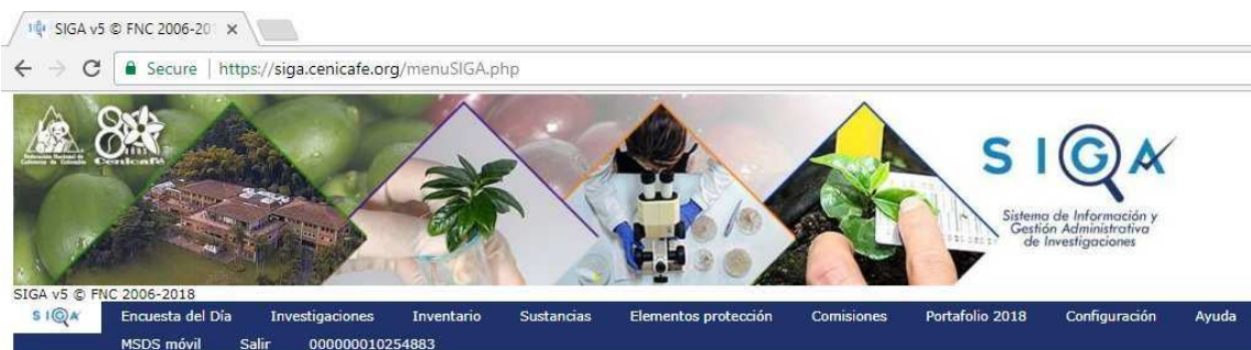
Figura 2. Menú principal del SIGA

El menú principal (Figura 2), le ofrece las siguientes opciones: